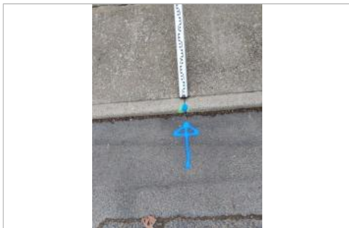
Marque sur le trottoir