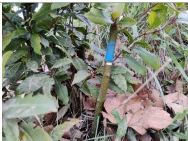
Trace de limon sur les feuilles

Altitude calculée de l'eau (en m) : 5.83 m