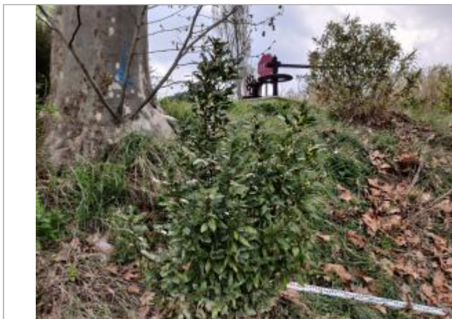
Laurier sauce en contrebas de la route