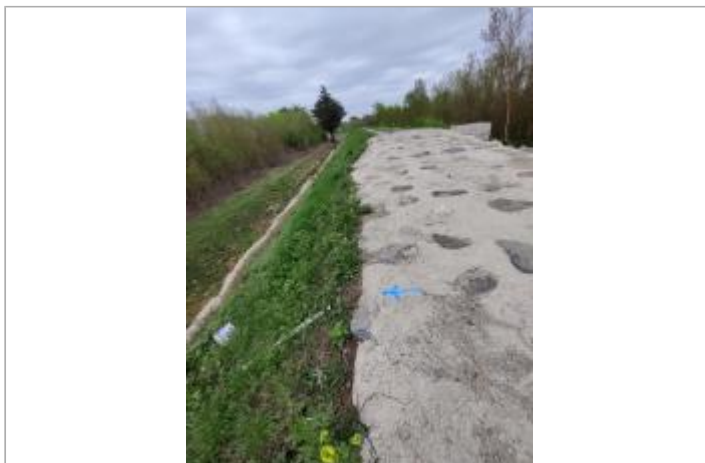
Talus de digue