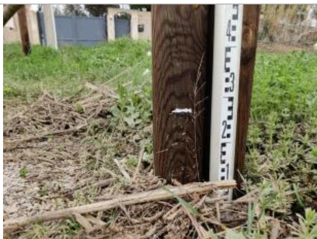
Trace sur le poteau de la barrière

Altitude calculée de l'eau (en m) : 5.81 m