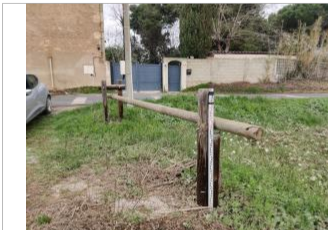
Barrière en bois parking privé