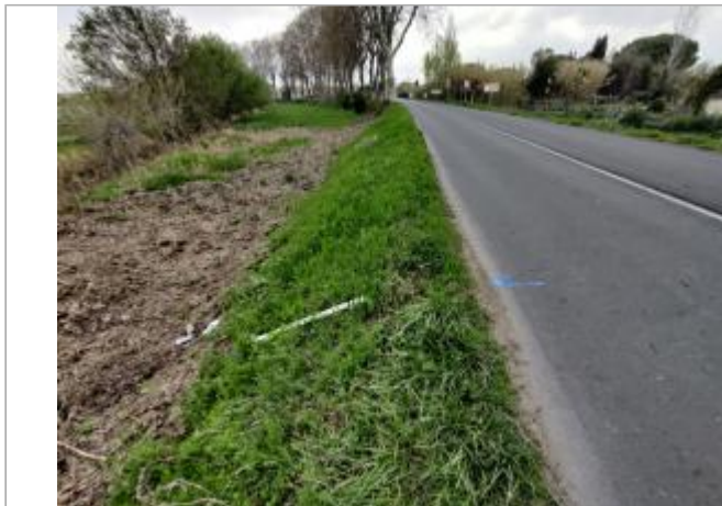
Talus de route