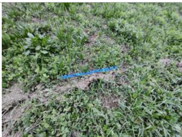
Dépôt contre la digue