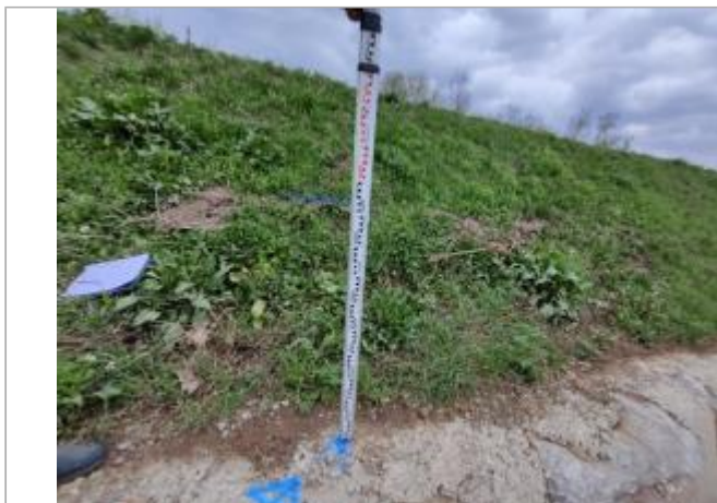
Talus de digue

Coordonnées WGS84 : X: 3.27647520 / Y: 43.28680840