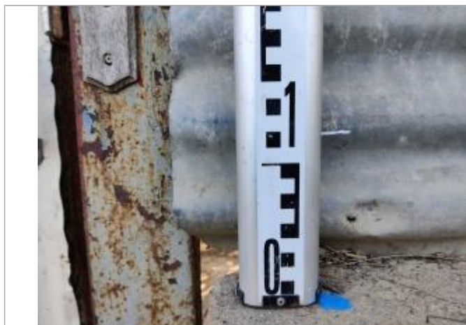
Trace sur la tôle