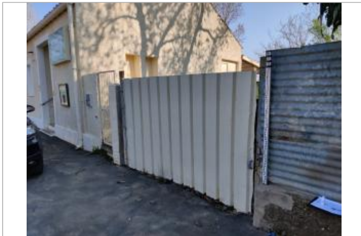
Palissade en tôle ondulée