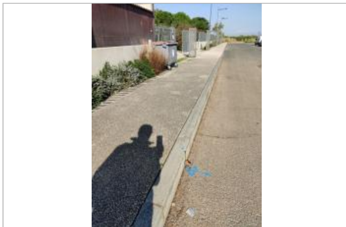
Bordure de trottoir