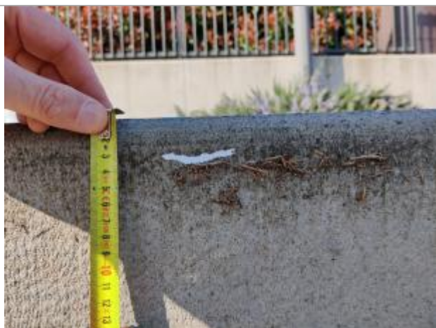
Trace sur la bordure

Altitude calculée de l'eau (en m) : 5.492 m