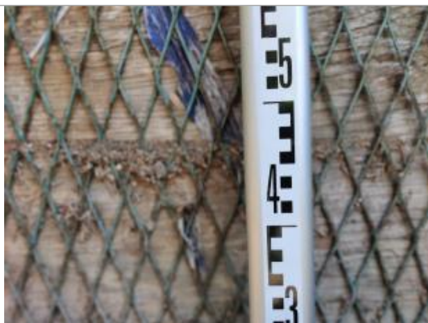
Trace sur le portail