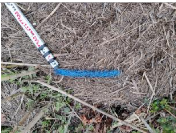
Dépôt contre les cannes de Provence

Altitude calculée de l'eau (en m) : 5.413 m