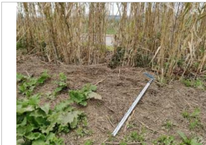
Cannes de Provence

Coordonnées WGS84 : X: 3.28128290 / Y: 43.30760310