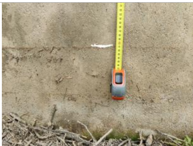
Trace sur l'ouvrage