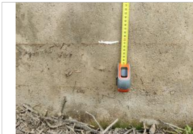
Trace sur l'ouvrage