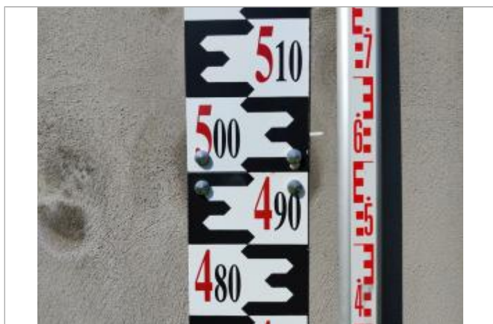
Trace sur l'Échelle