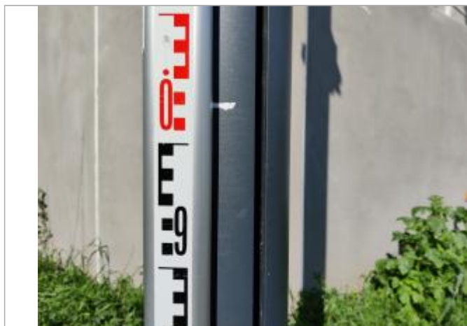
Trace sur le poteau