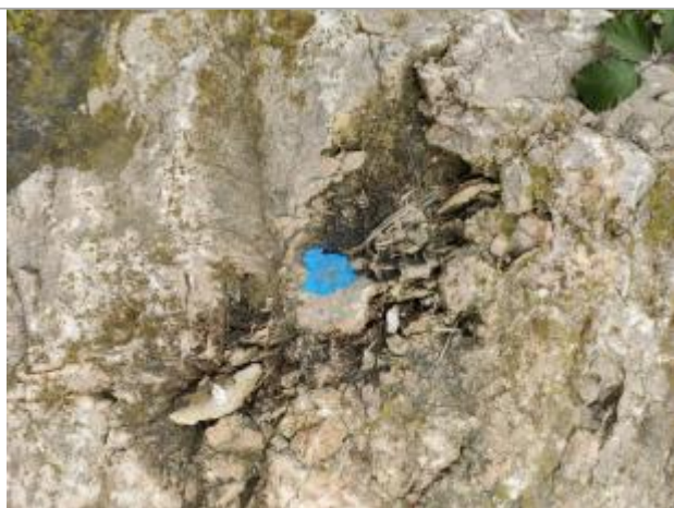
Dépôt sur le rocher