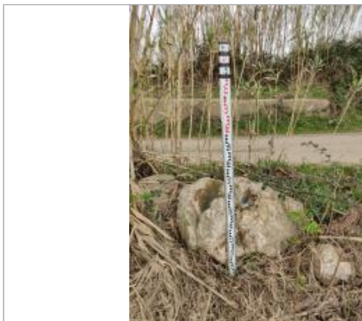
Rocher en bord de chemin

Coordonnées WGS84 : X: 3.28140540 / Y: 43.30745880