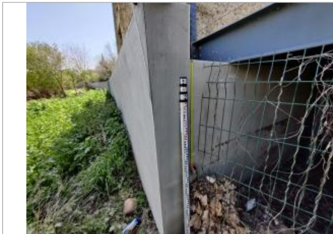
Mur de soutènement, passerelle piétonne

Coordonnées WGS84 : X: 3.28219930 / Y: 43.28315940