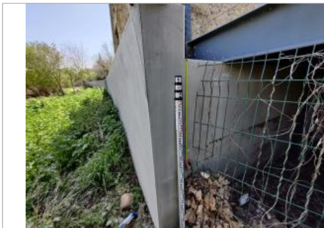
Mur de soutènement, passerelle piétonne