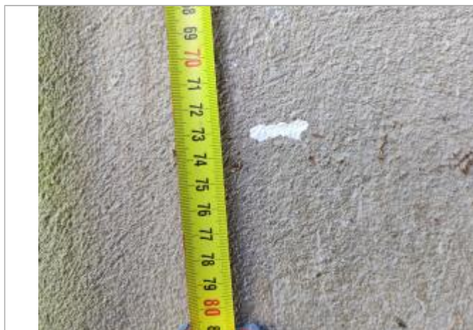
Trace sur le mur