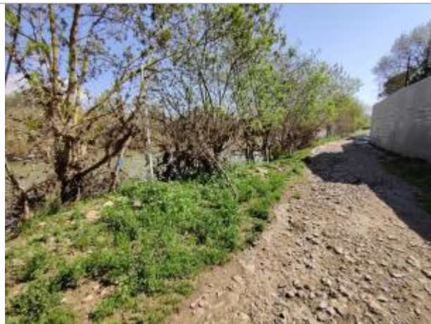
Arbre de berge