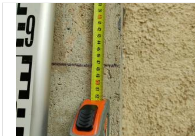
Marque sur la culée - 35cm sous repère de 1996

Altitude calculée de l'eau (en m) : 4.631 m