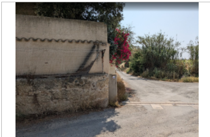
chemin barque vieille