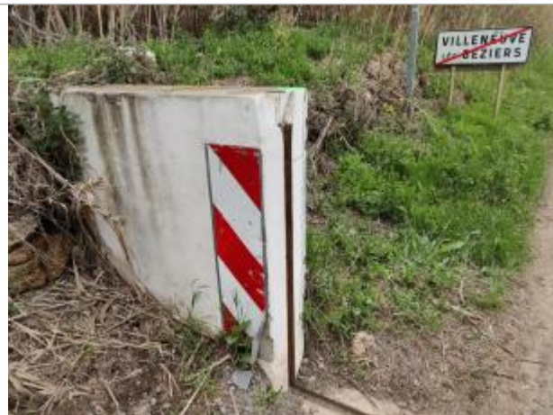
Culée de batardeau