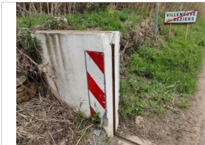
Culée de batardeau

Coordonnées WGS84 : X: 3.28310430 / Y: 43.31101670