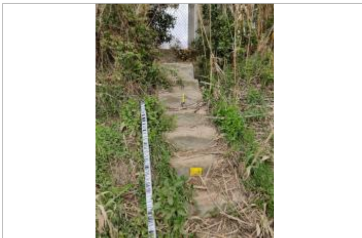
Escaliers de digue