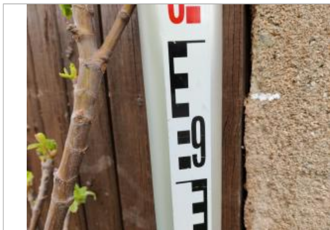
Trace sur la porte

Altitude calculée de l'eau (en m) : 4.559 m