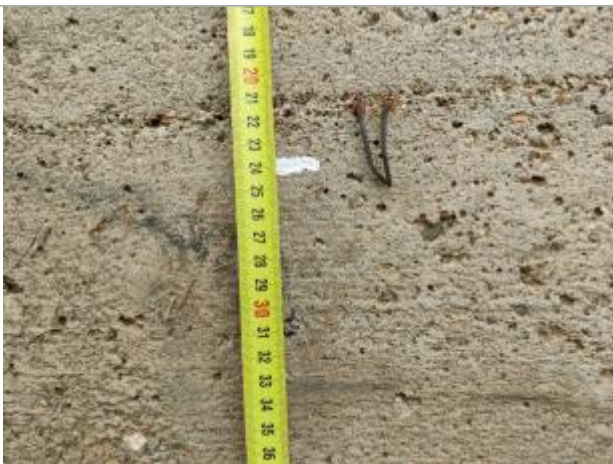
Trace sur la digue

Altitude calculée de l'eau (en m) : 4.5 m