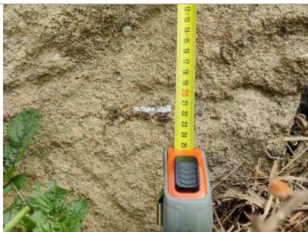
Trace sur une pierre de la digue