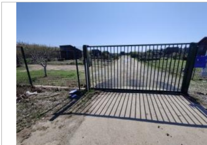
Portail d'entrée - Jardins partagés