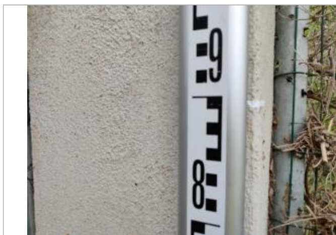
Trace sur le montant