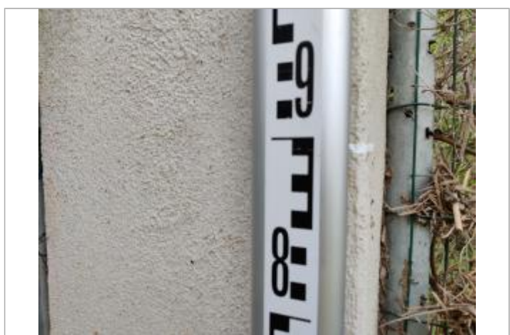
Trace sur le montant

GÉNÉRAL Code : 23_ORB22_R_122_1 Date de mise à jour : 26/04/2023 Auteur : SPC MO