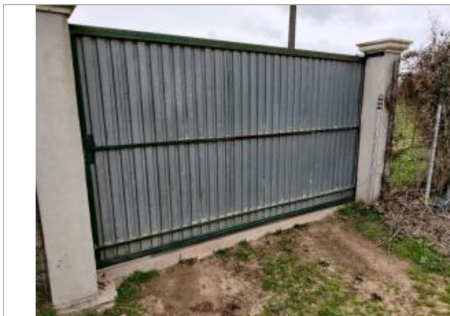
Montant de portail

Coordonnées WGS84 : X: 3.29057900 / Y: 43.30873000