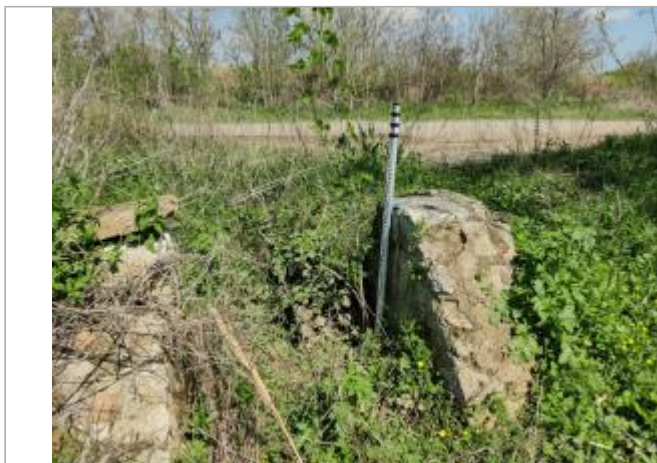
Ancien ouvrage de régulation