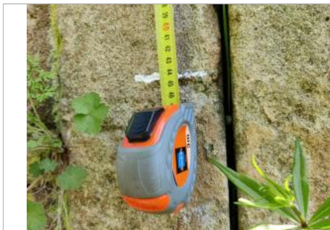
Trace sur la maçonnerie