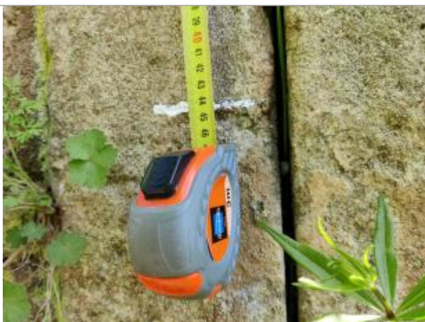
Trace sur la maçonnerie