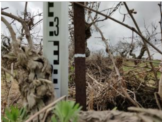
Trace sur les souches reporté sur le piquet

Altitude calculée de l'eau (en m) : 4.315 m