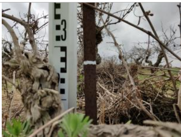
Trace sur les souches reporté sur le piquet