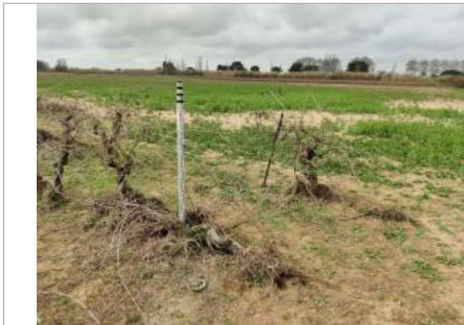
Piquet de tête

Coordonnées WGS84 : X: 3.28514210 / Y: 43.31006680