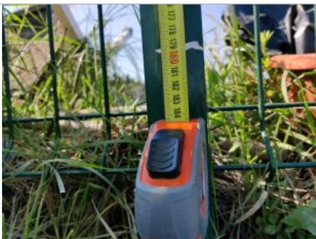
Trace dans le profilé