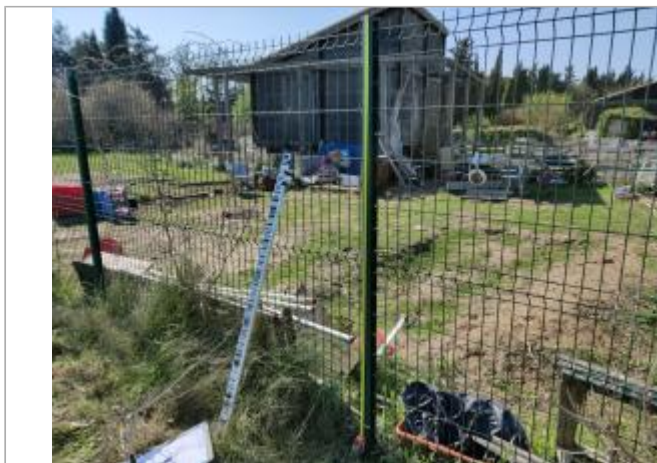
Piquet de clôture