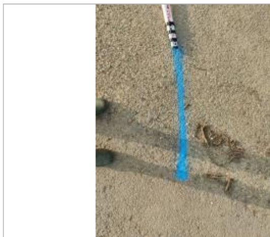
Dépôt sur le chemin

Altitude calculée de l'eau (en m) : 3.69 m