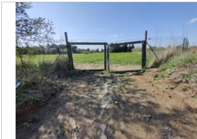
Piquet de clôture

Coordonnées WGS84 : X: 3.28844560 / Y: 43.27772760