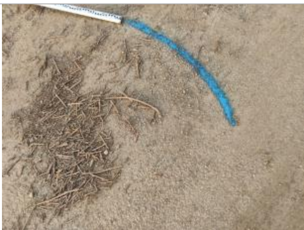
Dépôt sur le chemin

Altitude calculée de l'eau (en m) : 3.56 m