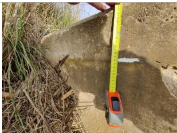
Trace sur le massif

Altitude calculée de l'eau (en m) : 3.462 m