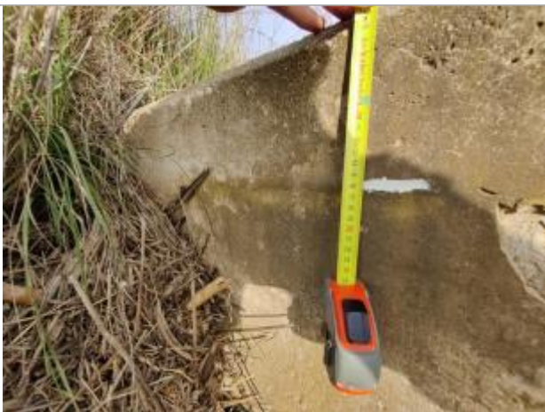
Trace sur le massif