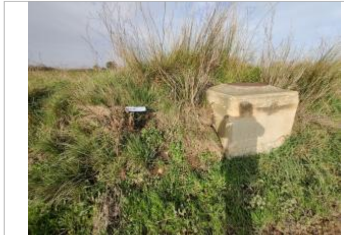
Massif de regard de visite

Coordonnées WGS84 : X: 3.29699960 / Y: 43.27862200