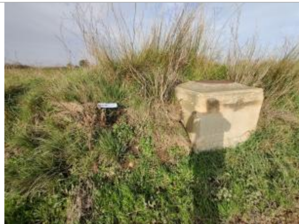
Massif de regard de visite