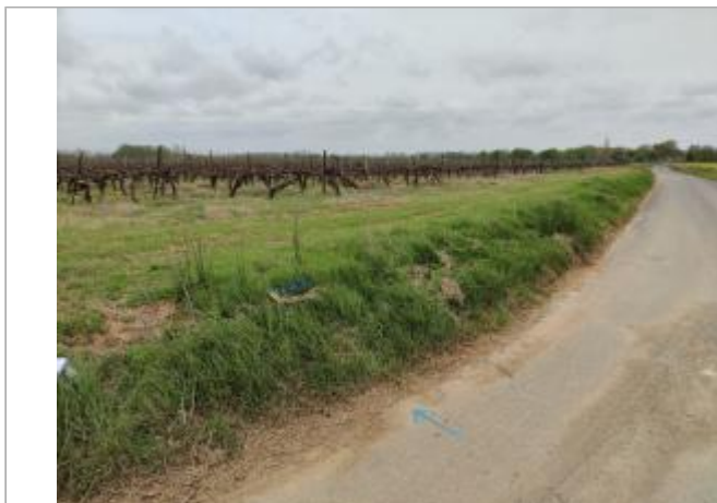
Talus en bord de chemin

Coordonnées WGS84 : X: 3.29743530 / Y: 43.30748790