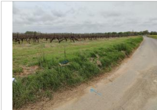
Talus en bord de chemin