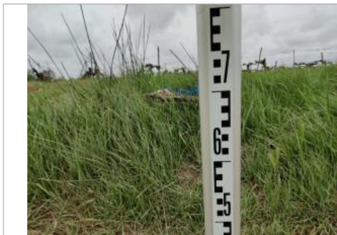
Dépôt contre le talus