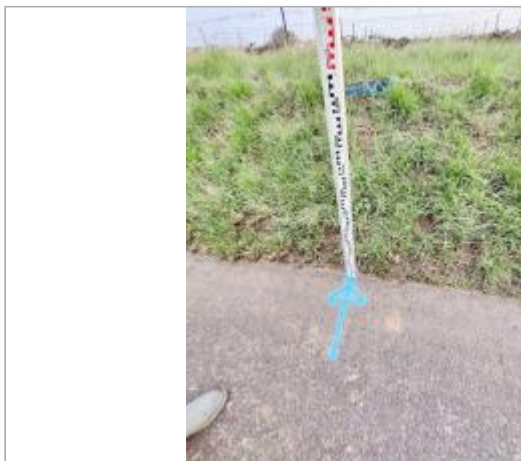
Talus en bord de chemin

Coordonnées WGS84 : X: 3.29058950 / Y: 43.27683130