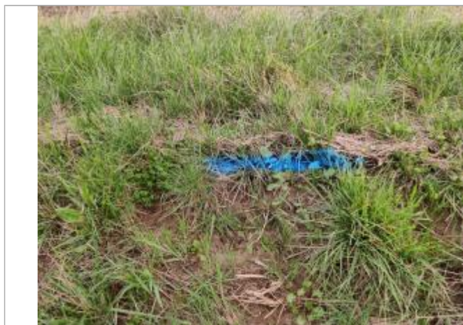
Dépôt contre le talus