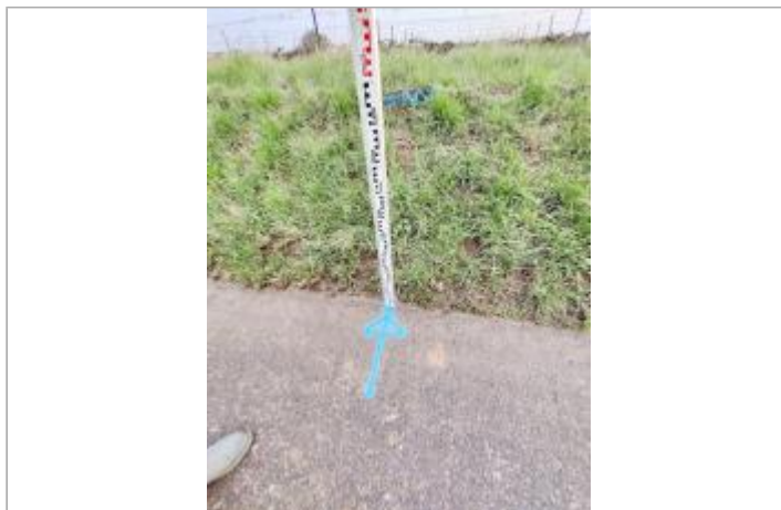
Talus en bord de chemin