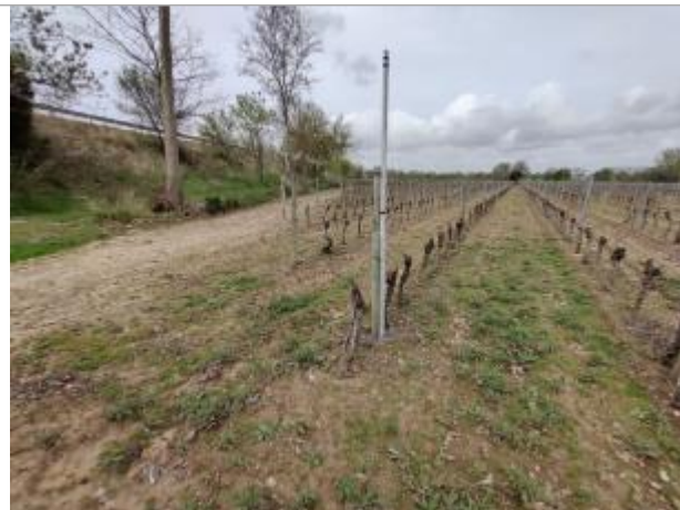
Piquet de tête