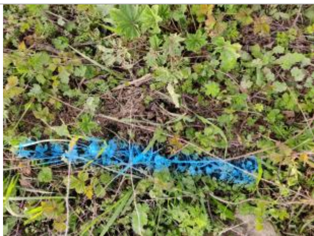
Dépôt dans l'herbe