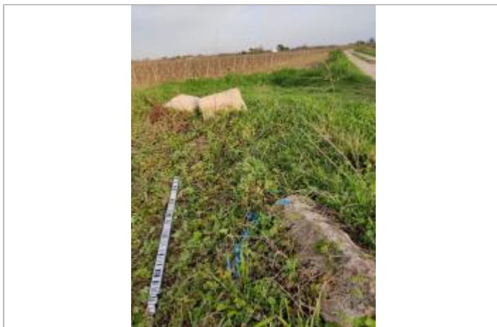
Bord de chemin