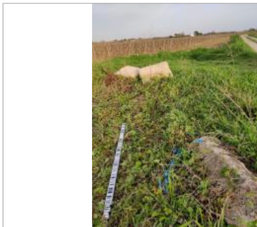
Bord de chemin

Coordonnées WGS84 : X: 3.30603120 / Y: 43.27945130