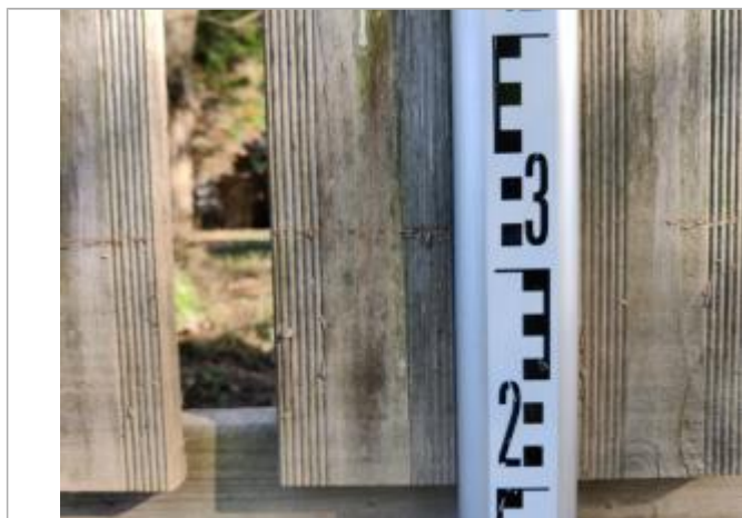
Trace sur les lames de bois

Altitude calculée de l'eau (en m) : 3.01 m