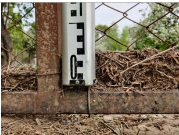
Débris végétaux sur le portail