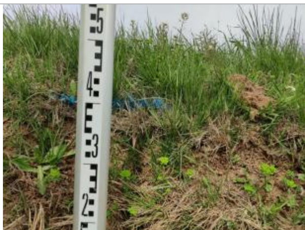
Dépôt contre le talus

Altitude calculée de l'eau (en m) : 2.947 m