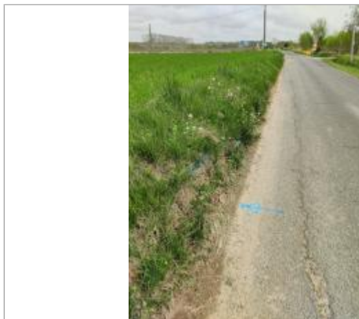
Talus bord de route

Coordonnées WGS84 : X: 3.29921830 / Y: 43.31352820