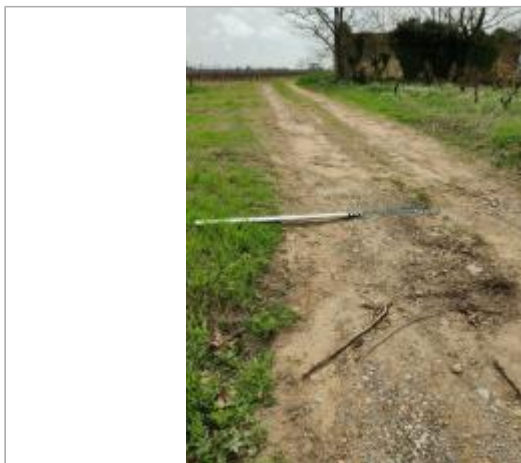
Chemin de vigne

Coordonnées WGS84 : X: 3.29693480 / Y: 43.31339950