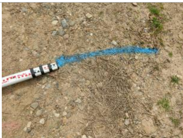
Dépôt sur le chemin

Altitude calculée de l'eau (en m) : 2.88 m