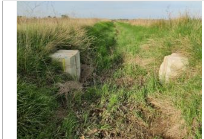
Batardeau de fossée

Coordonnées WGS84 : X: 3.30115880 / Y: 43.27653250