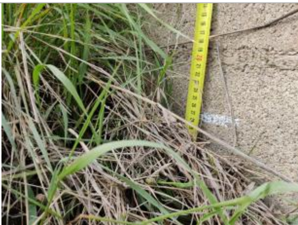
Trace sur la culée en parpaing

Altitude calculée de l'eau (en m) : 2.851 m