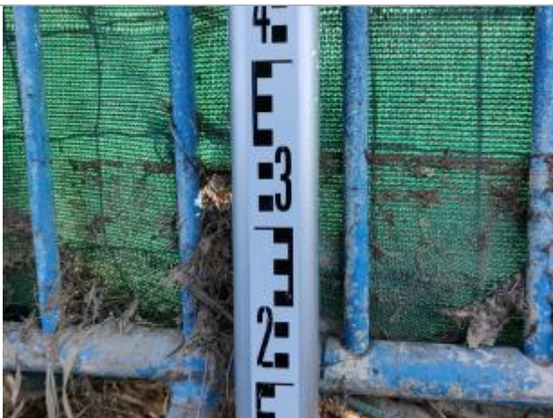
Trace sur le voile occultant

Altitude calculée de l'eau (en m) : 2.85 m