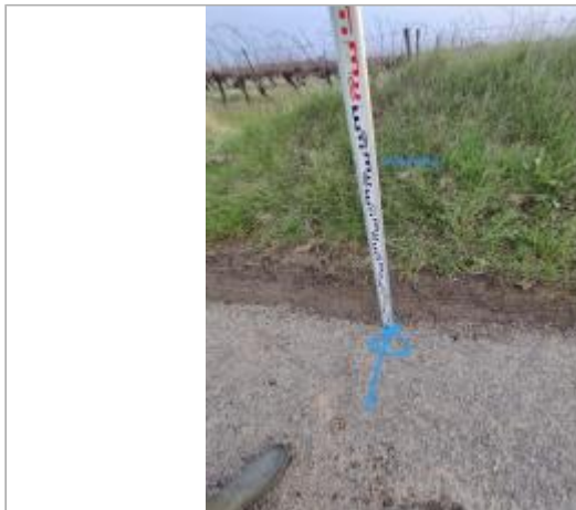
Talus en bord de chemin

Coordonnées WGS84 : X: 3.29598600 / Y: 43.27472970