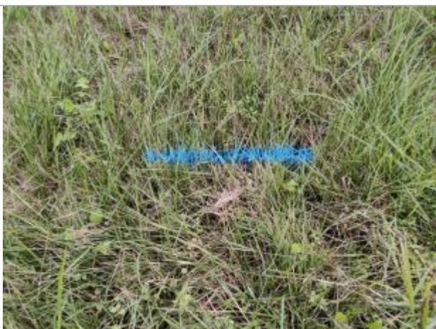
Dépôt contre le talus