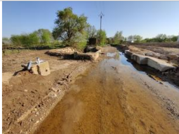
Massif béton, ancien batardeau