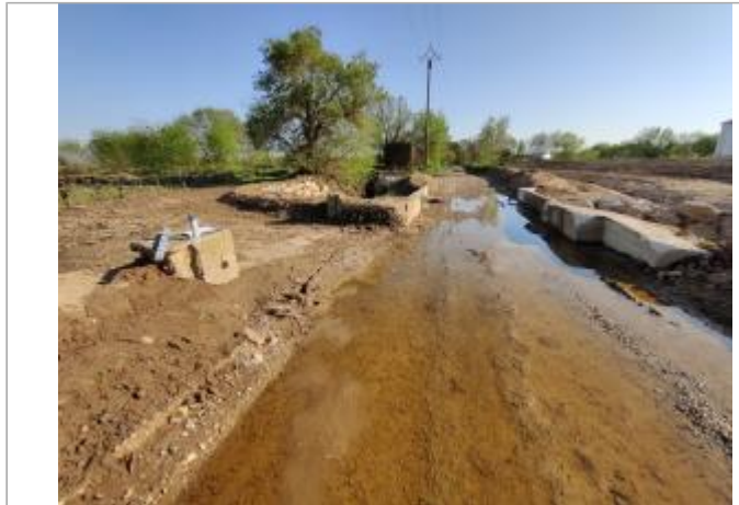
Massif béton, ancien batardeau

Coordonnées WGS84 : X: 3.28846280 / Y: 43.27131370