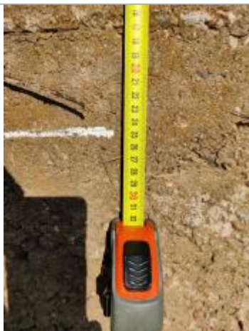
Trace sur le massif

Altitude calculée de l'eau (en m) : 2.82 m