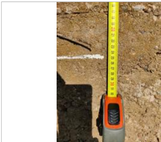
Trace sur le massif

Altitude calculée de l'eau (en m) : 2.82 m