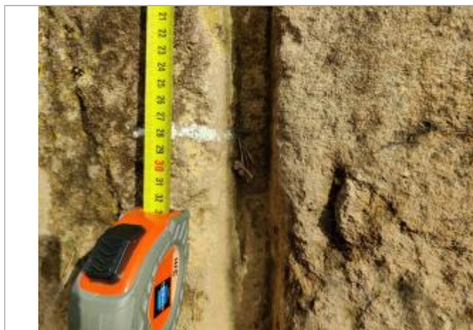
Trace sur la culée du batardeau

Altitude calculée de l'eau (en m) : 2.818 m