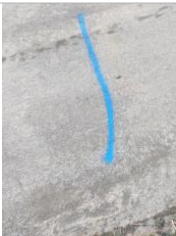
Dépôt sur la chaussée

Altitude calculée de l'eau (en m) : 2.72 m