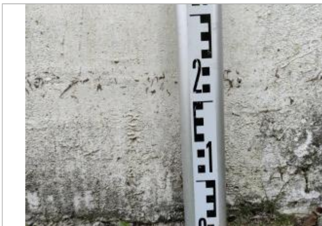
Trace sur le mur

Altitude calculée de l'eau (en m) : 2.56 m