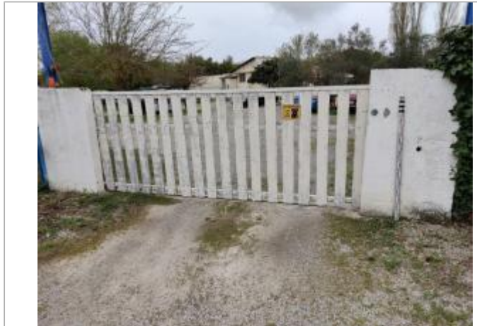
Mur à droite du portail

Coordonnées WGS84 : X: 3.31136720 / Y: 43.31433050