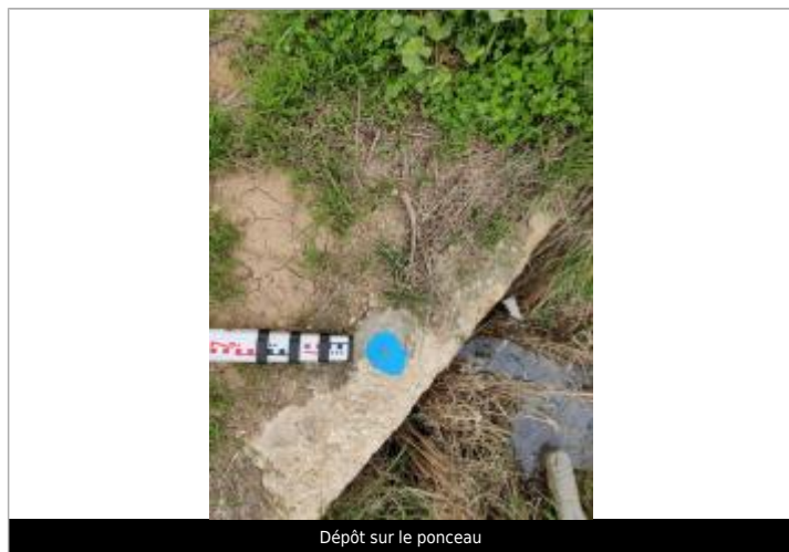
Dépôt sur le ponceau