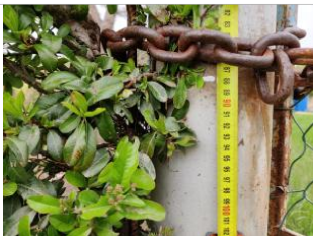
Trace sur la végétation reportée sur le montant