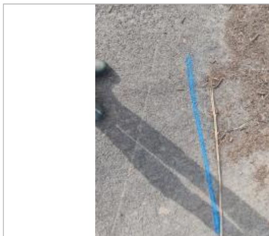
Dépôt sur la chaussée