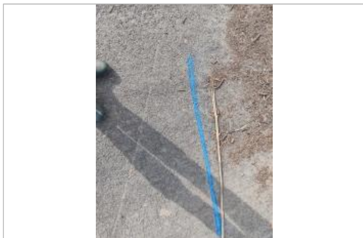
Dépôt sur la chaussée