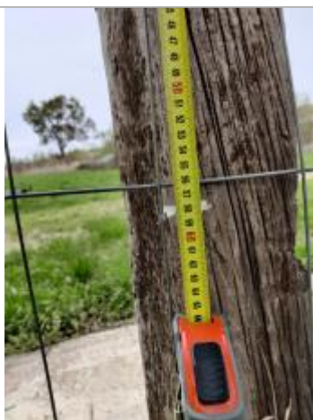
Trace sur le poteau

Altitude calculée de l'eau (en m) : 2.475 m