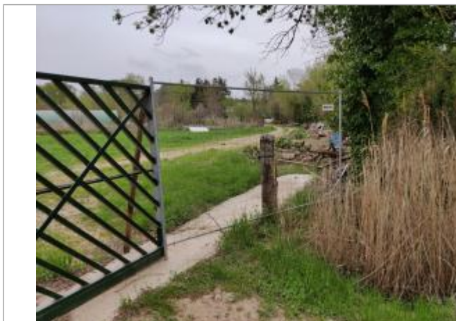
Poteau en bois

Coordonnées WGS84 : X: 3.32641890 / Y: 43.30356310