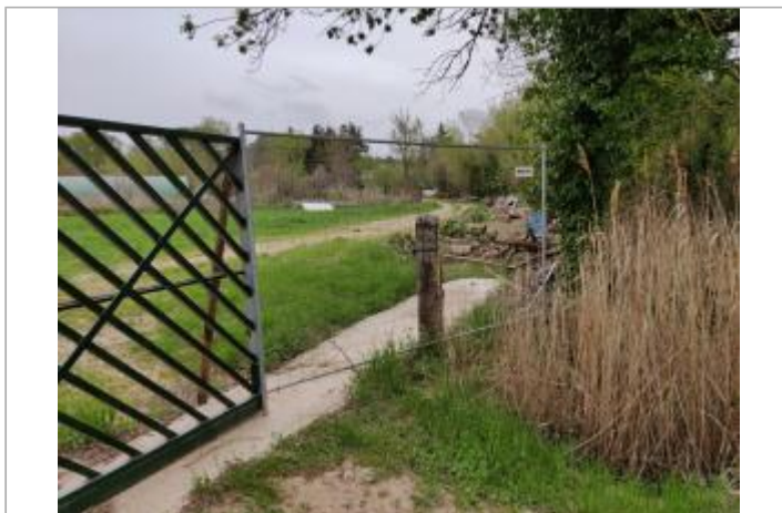
Poteau en bois